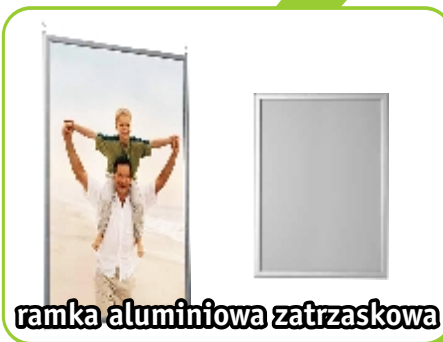
ramka aluminiowa zatraskowa

Więcej szczegółów na stronie: http://kontrast.gda.pl/oferta.html