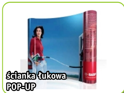
ścianka łukowa POP-UP