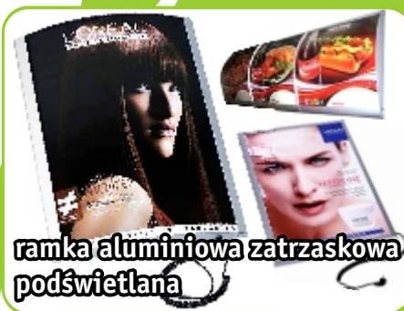
ramka aluminiowa zatraskowa podświetlana