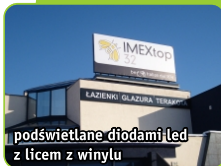
podświetlane diodami led z licem z winylu