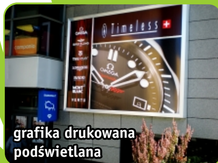
grafika drukowana podświetlana