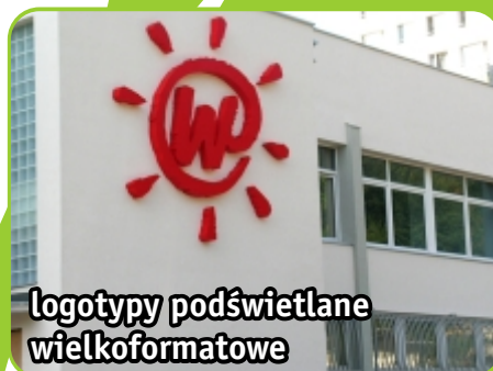
logotypy podświetlane wielkoformatowe