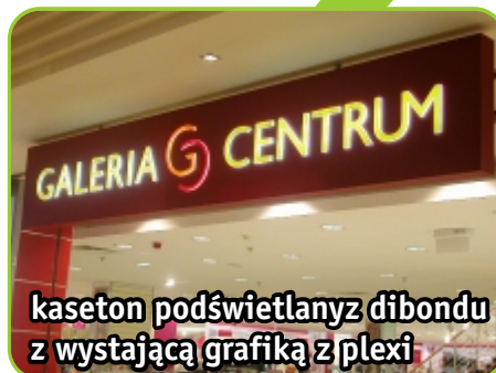
kaseton podświetlany z dibondu z wystającą grafiką z plexi