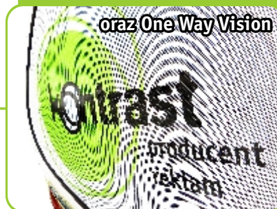
oraz One Way Vision