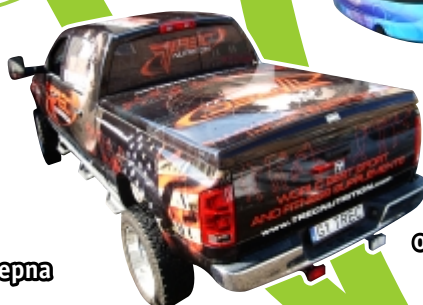
folia wylewana oraz One Way Vision