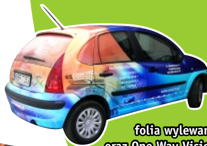
folia wylewana oraz One Way Vision