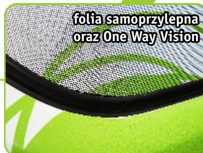
folia samoprzylepna oraz One Way Vision