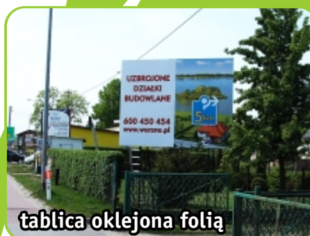
tablica oklejona folią